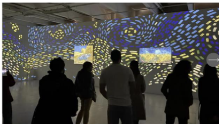
Des toiles de maîtres, ici Vincent Van Gogh, revisitées par le vidéo mapping, un vrai travail d'artistes. Dernier jour ce dimanche.

Le Tripostal continue, jusqu'à ce dimanche, le parcours de vidéo mapping autour de tableaux célèbres. Un moment d'exception dont vous ne reviendrez pas. Et c'est gratuit.