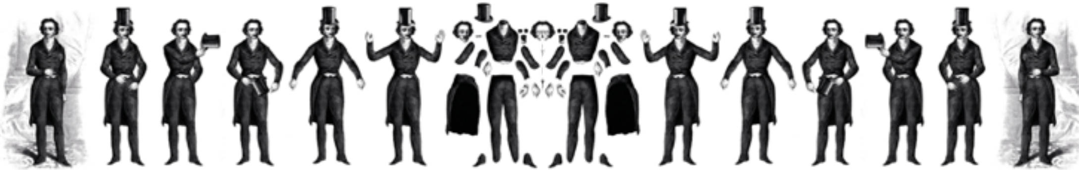
Rodolphe de Gérolstein, le héros