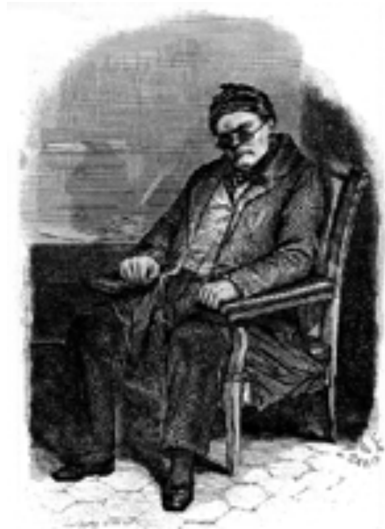
L'abominable Maître Ferrand, le "pivot de tous les crimes"

La musique a été réalisée par Christophe Berthaud qui a composé de petites pastilles musicales toujours pleine d'humour ou d'empathie, rehaussées par le sound design fantaisiste ou réaliste d'Arsène Roy et le mixage du talentueux et fidèle Antonin Léger.