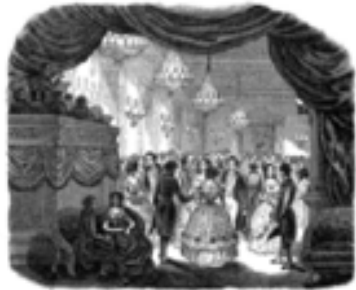
Les beaux quartiers