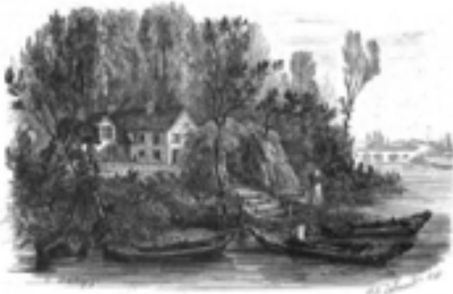
L'île des Rameurs