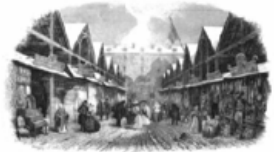
Le marche du Temple