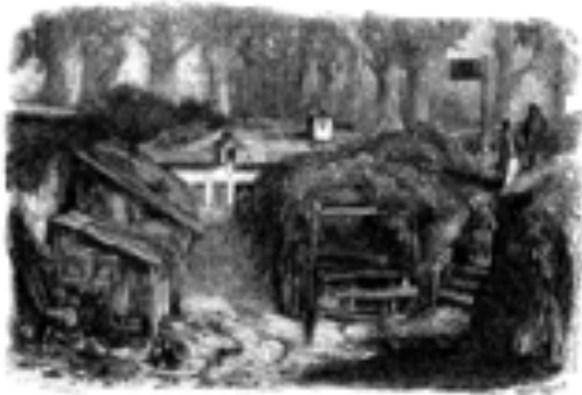
L'aberge du Coeur Saignant