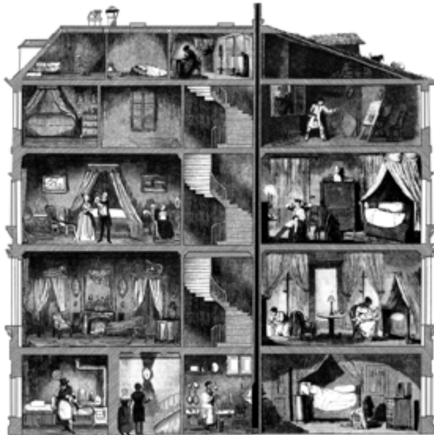
17 rue du Temple, où "sévit" Madame Pipelet