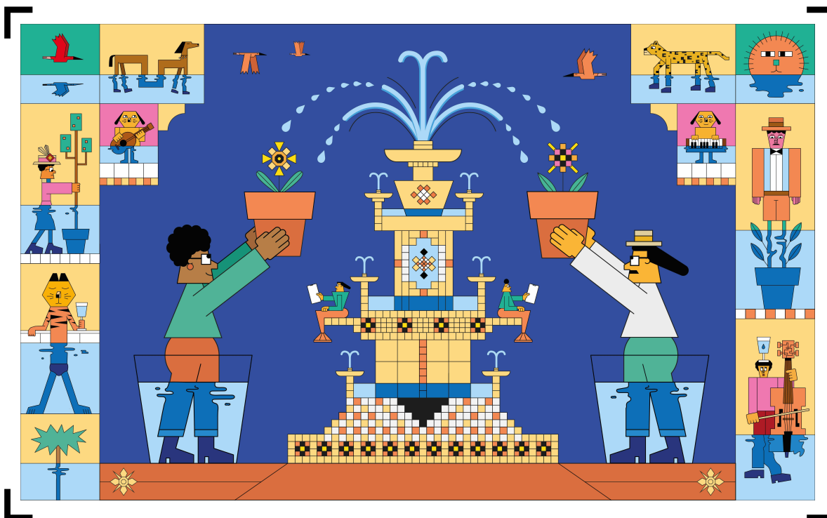
Illustration et direction artistique : Guillaumit Développement : Alexandre Coirier Musique : Gangpol