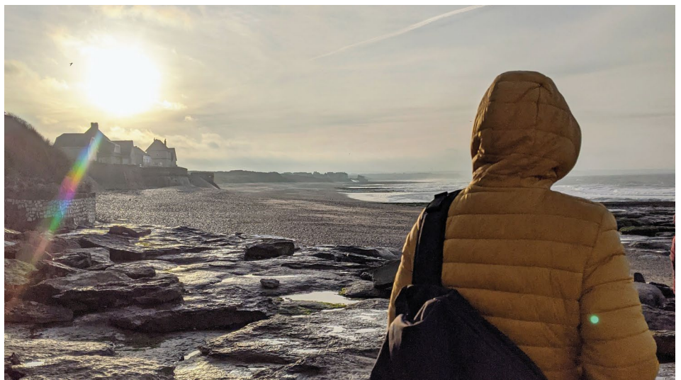
Tournage sur le voilier Fletcher Lynd dans le cadre de l'exposition Mémoire du futur .

Source : Environnement et Climat, de nouveaux enjeux pour les acteurs de l'audiovisuel, Etude Workflowers / Ecoprod, novembre 2020.