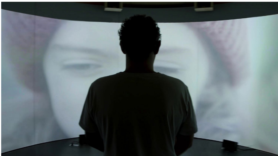
Blue Box ® installée au Bazaar St-So en octobre 2021 dans le cadre de l'exposition Mémoire du futur .

De façon ludique, les participants seront invités à suivre les conseils de Martin à chaque étape. Ils pourront ainsi agir positivement pour la planète et l'humanité.