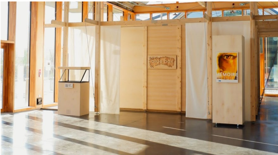
Blue Box ® installée au Bazaar St-So à Lille en octobre 2021 dans le cadre de l'exposition Mémoire du futur .

Grâce à Blue Box ® , véritable levier émotionnel, l'exposition Mémoire du futur se transforme en puissants souvenirs positifs. Ces espaces nomades éco-conçus de 80m 2 subliment les expositions empreintes de positivité sur des thèmes engagés.